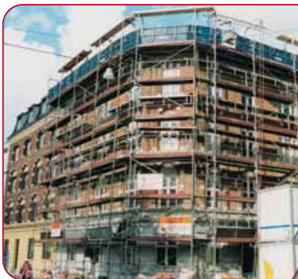
Gl. bolig- byggeri 217,56 kr.