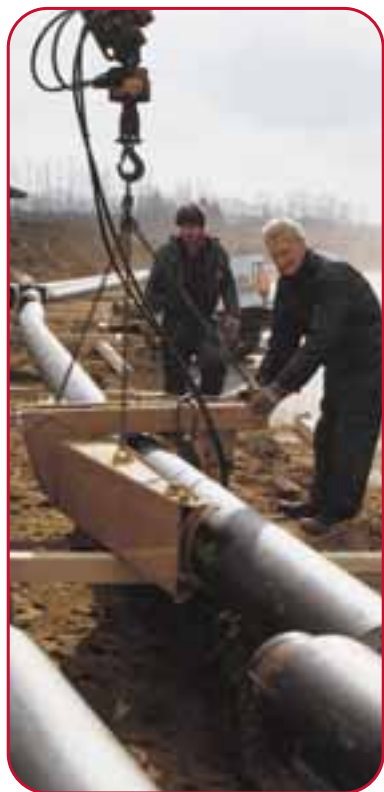
Fjernvarme 251,58 kr.