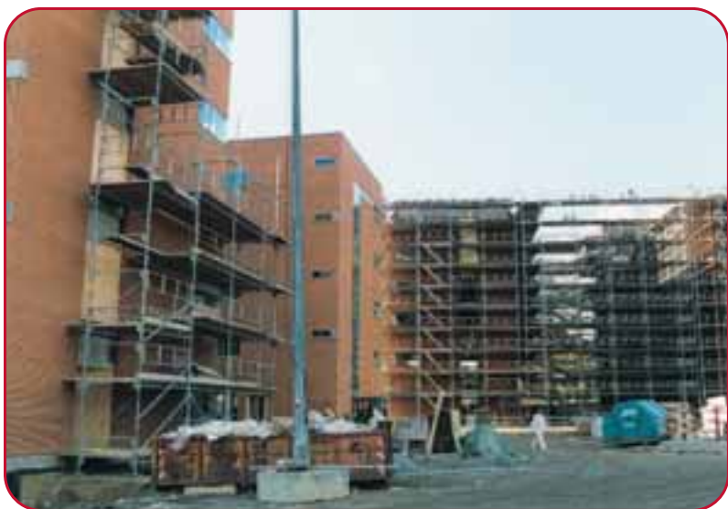
Nyt kontor-/ socialbyggeri 205,54 kr.