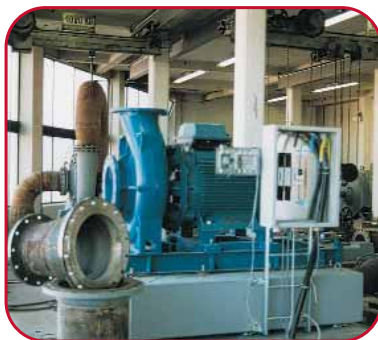
Gl. industribyggeri 213,95 kr.