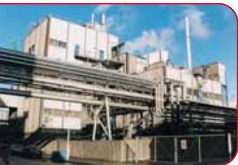
Nyt industribyggeri 205,46 kr.