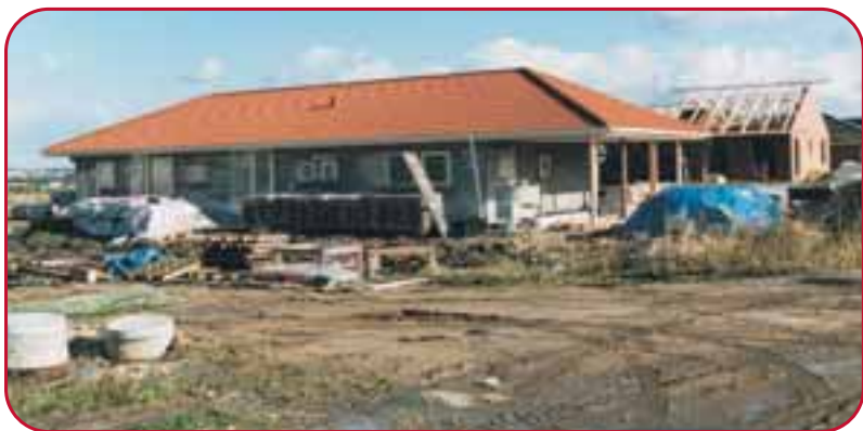
Nyt boligbyggeri 216,56 kr.