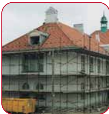
Gl. kontor/ socialbyggeri 209,96 kr.